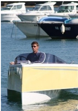
Le Zéphir de Naviwatt

Marins, à l'heure où le prix à la pompe explose, n'hésitez plus, adoptez le bateau électrique !