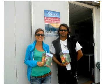
66 Nautic (Location de bateaux à Port Barcarès) a rejoint la campagne en 2011.

Des actions uniques en France, récompensées par l'ADEME, qui ont abouti à un partenariat fort avec la Fondation Nicolas Hulot et la reprise du concept Echo-Gestes sur d'autres régions maritimes : Bretagne, Aquitaine et bientôt Normandie.