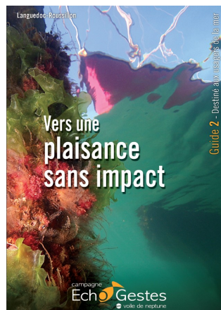
Guide informatif et pédagogique

Pour stimuler le changement, le guide pédagogique, « Vers une plaisance sans impact », informe des impacts liés aux activités marines, explique les effets sur les habitats, la vie marine et la santé humaine, et propose des solutions concrètes pour une pratique durable de son activité.