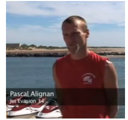
Plus d'information sur son site: www.jetevasion34.com

Jamais découragé, sa démarche est volontaire et sa motivation ne faiblit pas. Nous lui souhaitons bon courage dans sa démarche exemplaire et le soutenons en mettant en avant ses initiatives novatrices !